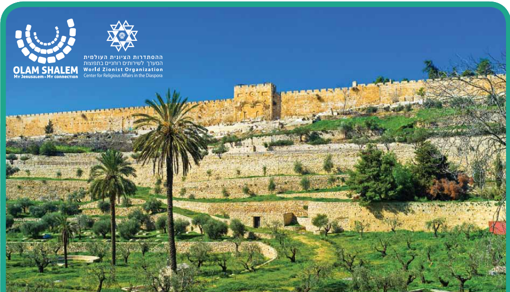
IEFE NOF | יפה נוף Bello p aisaje