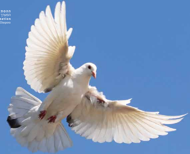
IR HAIONÁ | העיר היונה La ciud ad paloma