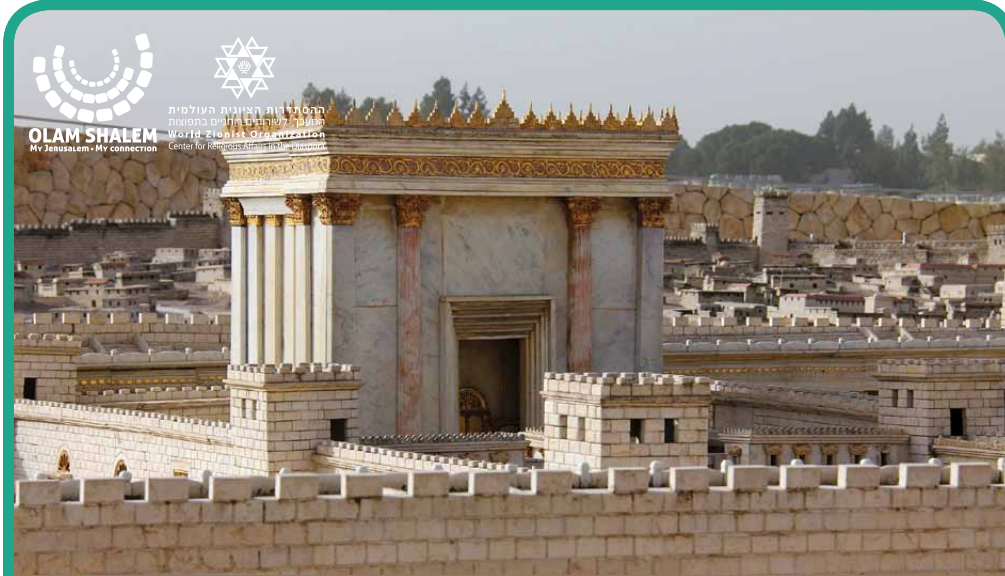
בית אל | BET EL Casa de Dios