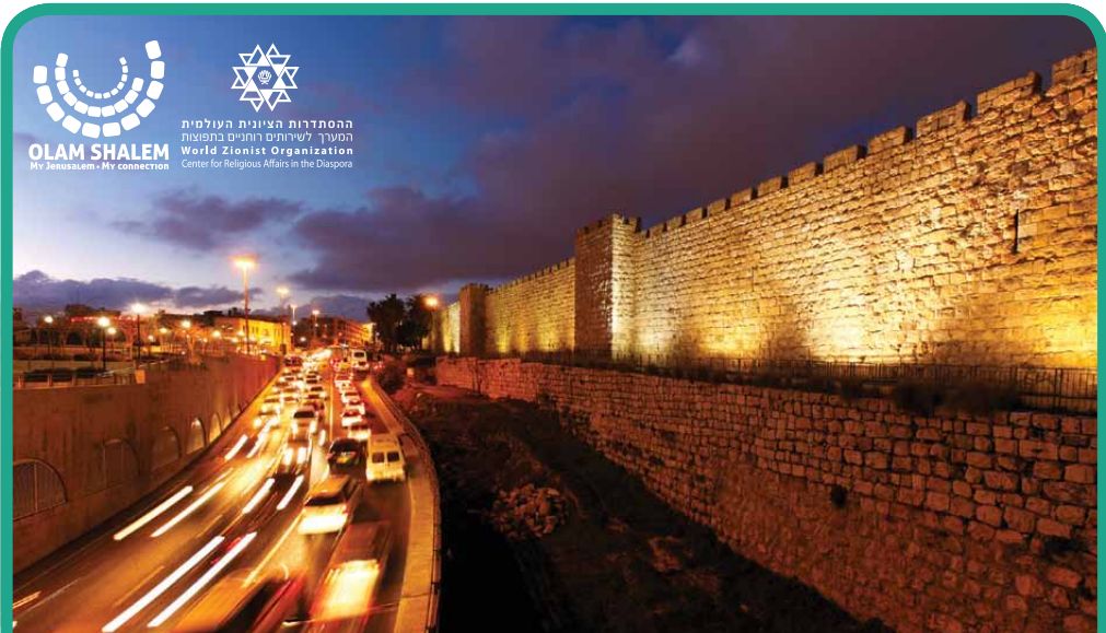
KLILAT IOFI | כלילת יופי Bel leza completa