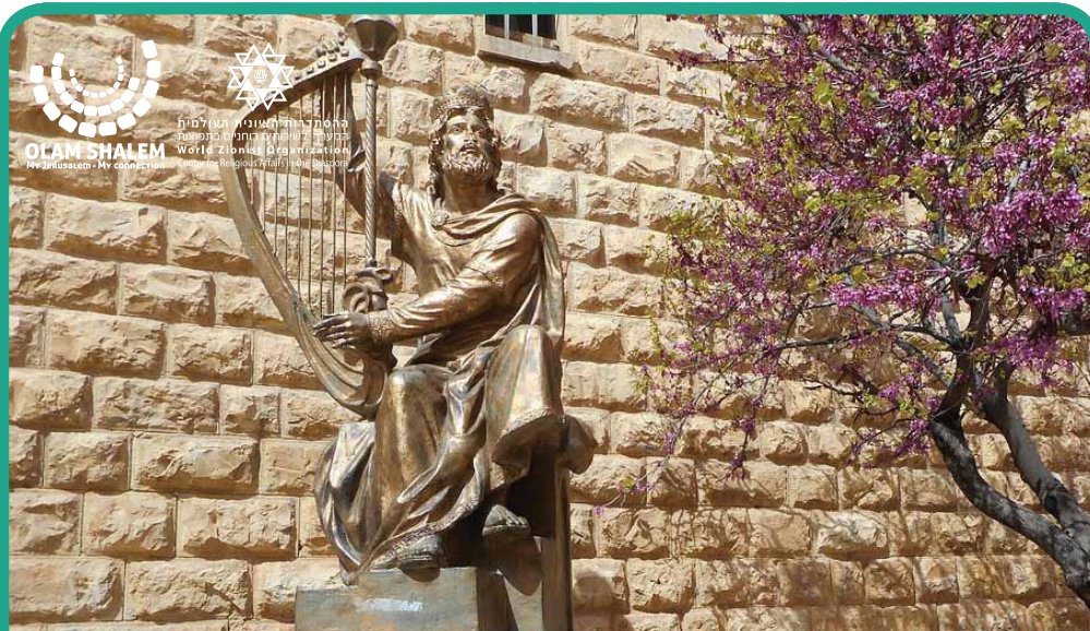
קריית מלך רב | Kiryat melech rav La Ville du Puissant Roi