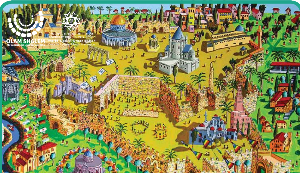
Daltot heamim | דלתות העמים Les Portes des Nations