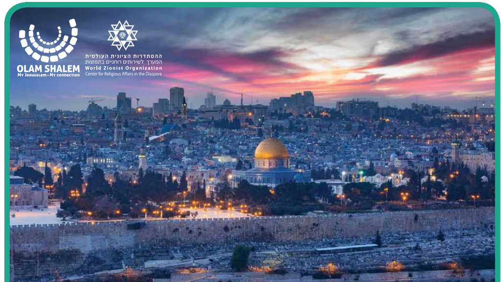
שלם | Shalem La Parfaite