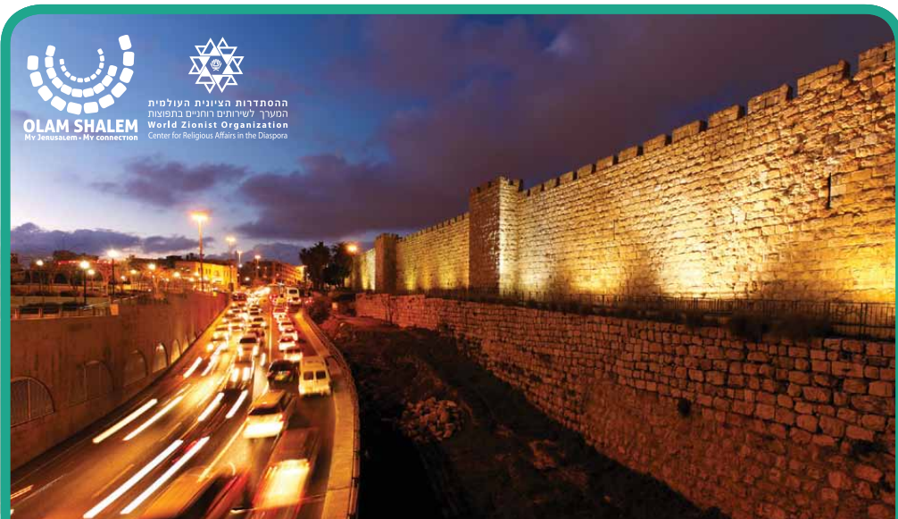
כלילת יופי | Kelilat yofi La Beauté Parfaite