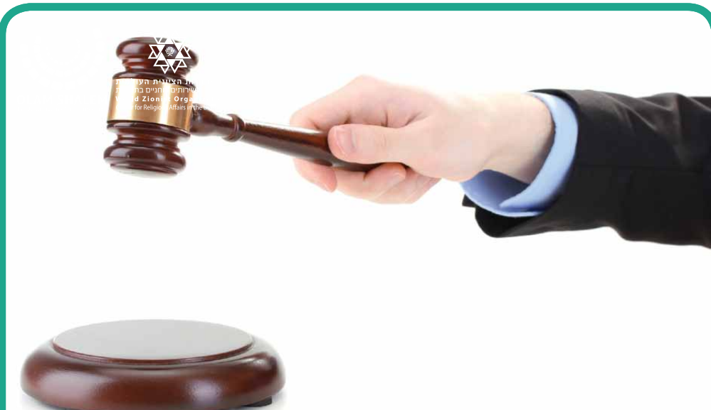
קריית הצדק | Kiryat hatzedek La Ville de la Justice