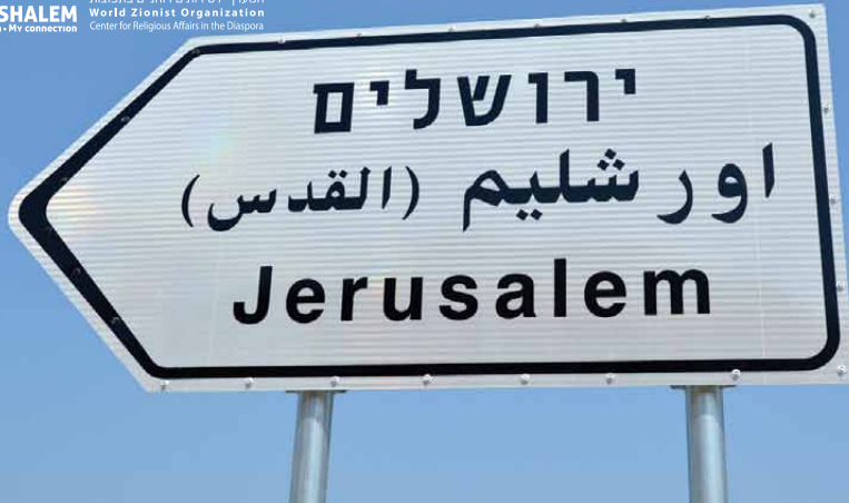
ירושלים | Yerushalayim il verra [Dieu] + complète