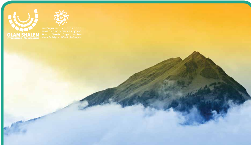
Marom | מרום Le Sommet