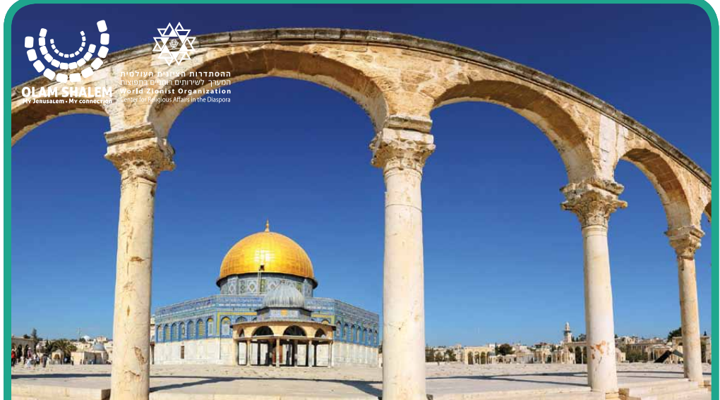
הר המוריה | Har hamoriah Le Mont Moriah