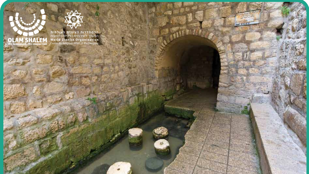
עיר דוד | Ir david La Cité de D.ieu