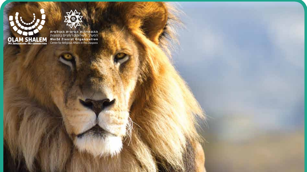
אריאל | Ariel Le Lion de D.ieu