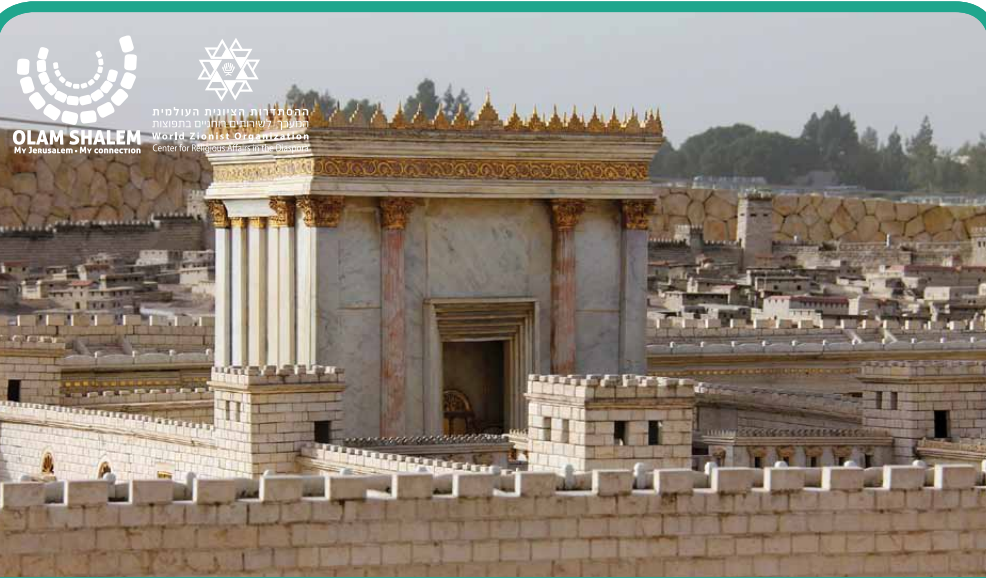
Beit el | בית אל La Maison de D.iou