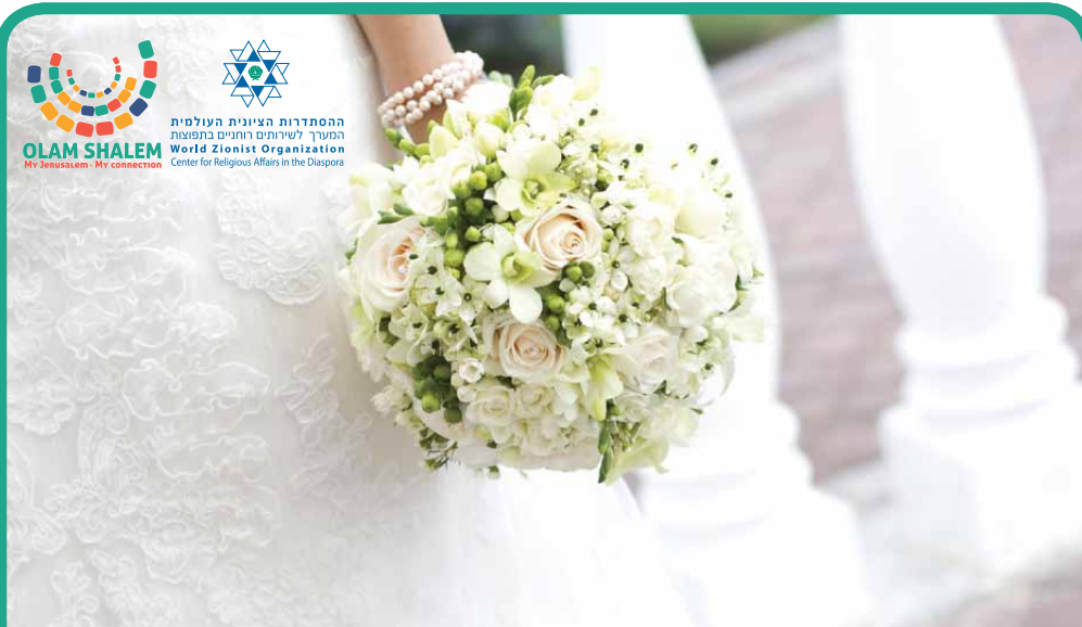
Kala | כלה La Mariée