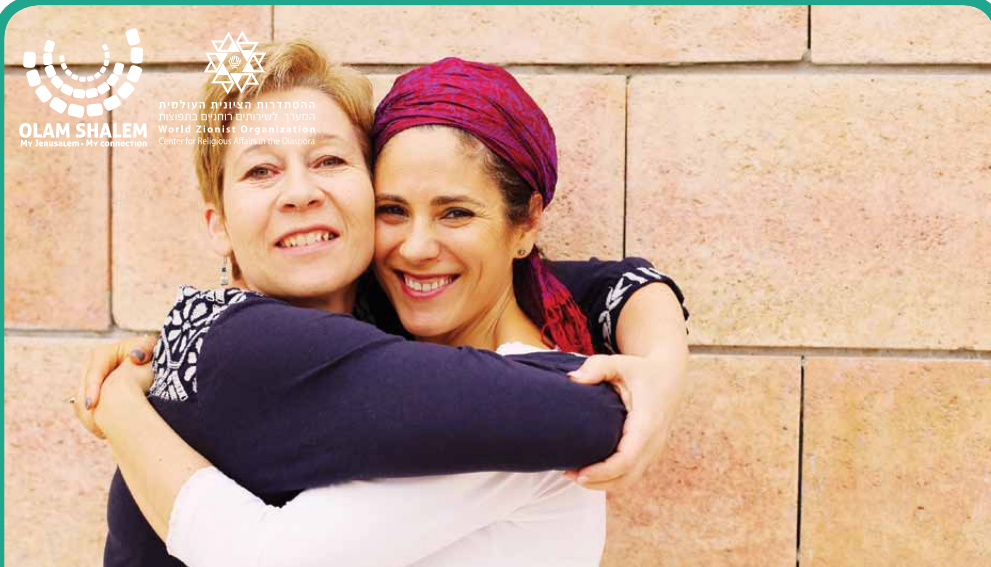
ידידות | Yedidut Fraternité-Amitié