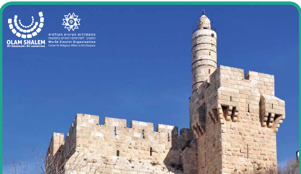
מצודה | Metzoda La Forteresse