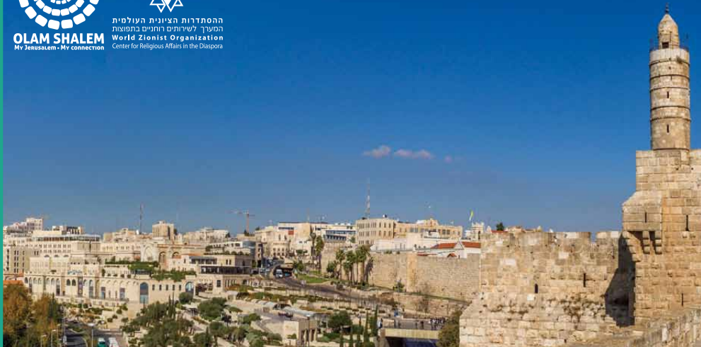
עיר שחברה לה יחדיו | Ir shehubra la yachdav Une ville qui unit autour d'elle