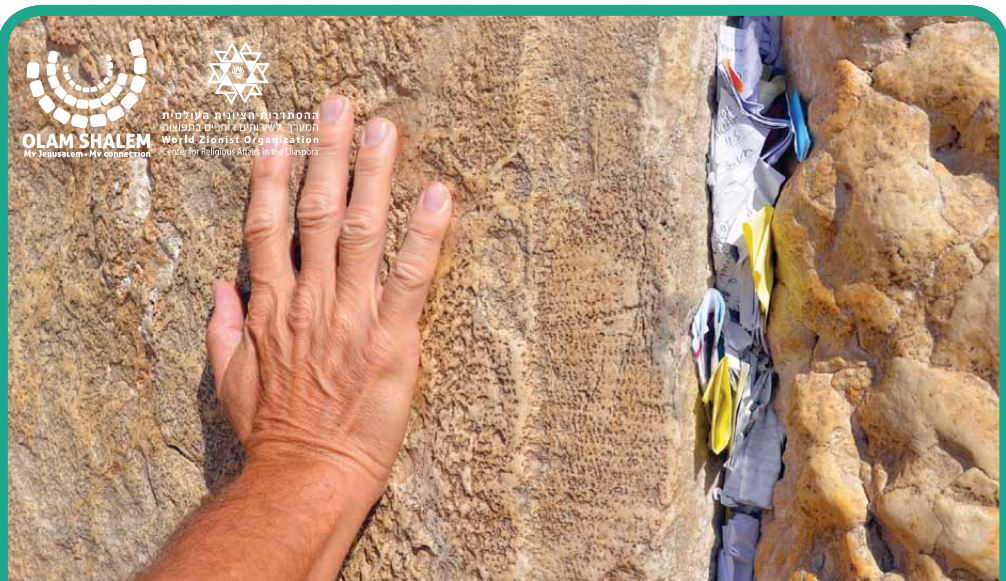
בית תפילה | Beit tefila La Maison de Prières